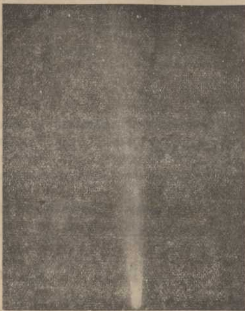
El Cometa Halley, fotografiado el 7 de Mayo de 1910 del Observatorio de Lowell.

Es el más famoso y el más brillante de todos los cometas. Fué observado por los chinos en el año 12 antes de J. C. y también en los años 66 y 141 de nuestra era; en el año 837, en tiempos de Luis el Piadoso, de Francia; en 989, por los chinos otra vez; en 1066, cuando la invasión de Inglaterra por los normandos; en 1301, fué observado desde toda Europa; en 1378, desde China y Europa; reapareció en 1456, cuando la guerra del Papa Calixto III contra el Sultán Mahomet II (Batalla de Belgrado); en 1531, fué observado por los astrónomos Apiano y Fracastor; en 1607, lo fué por Kepler y Longomontano; en 1682 por Halley y otros astrónomos; en 1757, fué observado universalmente, lo mismo que en 1835. En fin, en 1910 apareció en circunstancias excepcionales de observación.